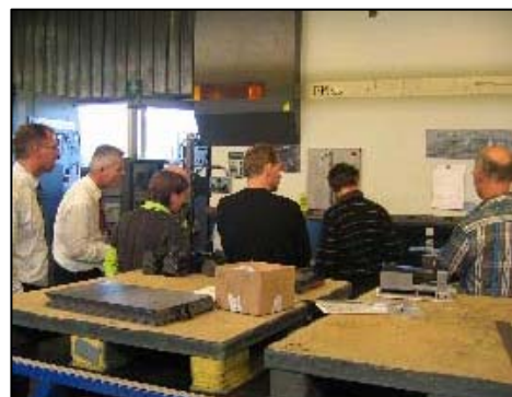
Figuur 2. Suplacon

Om de leden van KKNN en Kwaliteitskring Flevoland (KKF) een groter activiteiten aanbod te bieden, kunnen leden van beide verenigingen aan een activiteit deelnemen die door KKNN of KKF georganiseerd wordt. Voorbeelden hiervan zijn de bedrijfsbezoeken in oktober aan Suplacon te Emmeloord en in november aan Mitsubishi Equipement Europe te Almere. Daarnaast wordt, sinds 1 september 2007, het secretariaat van KKF vanuit het KKNN kantoor in Groningen uitgevoerd.