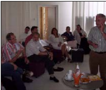
Figuur 3. Six Sigma

In het jaar 2007 werden er in samenwerking met verschillende organisaties drie Netwerkcafés georganiseerd. In januari organiseerde KKNN in samenwerking met de Nederlandse Vereniging voor Personeelsmanagement en Organisatieontwikkeling (NVP), het Personeels Adviseurs NETwerk (PANet) en Vereniging Hoofden Personeel en Organisatie Gezondheidszorg (VHPG) het eerste Grand-Netwerk-Café van het jaar. Het Grand-Netwerk-Café begon die dag met een lezing over bedrijfsfraude, gevolgd door het gebruikelijke kennismaken, discussiëren en netwerken. In mei werd in samenwerking met KIVI-NIRIA (de beroepsvereniging voor ingenieurs) een gezamenlijk netwerkcafé in het teken van Six Sigma georganiseerd. Het laatste Netwerkcafé vond in augustus plaats. Deze keer waren we te gast bij StudEnterprise, een stichting die de helpende hand biedt aan studentondernemers door het verhuren van kantoorruimten en organiseren van activiteiten.