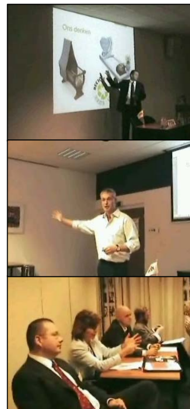
Figuur 6. Q-dag