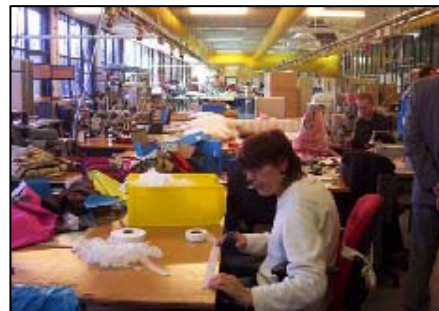
Figuur 7. DWS Stadspark

In 2007 hebben we opnieuw twee halfjaarprogramma's samengesteld en op handzame A-5 kaarten uitgegeven. Op ieder overzicht zijn de georganiseerde activiteiten voor het betreffende halve jaar gezet, zodat we iedereen binnen de kring op een duidelijke en eenvoudige manier op tijd op de hoogte konden brengen van onze activiteiten.