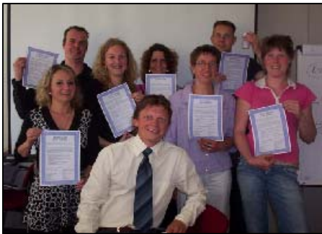
Figuur 5. "Interne Audits"

Doel: Intensievere kennisoverdracht aanbieden aan onze leden.